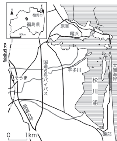
図-1 研究対象地と松川浦

本研究では、地域の資源を生かして地域の活性化を意図する“観光”を基軸とした地域づくりにおいて、何が課題となり重視されたかを明らかにし、地域づくりに求められる共通要因を明らかにすることを目的とする。対象地としては、恵まれた自然環境と第一次産業である漁業とともに、第三次産業としての観光産業で成り立っていた相馬市の松川浦エリア(原釜・尾浜地区)を選定した(図-1)。